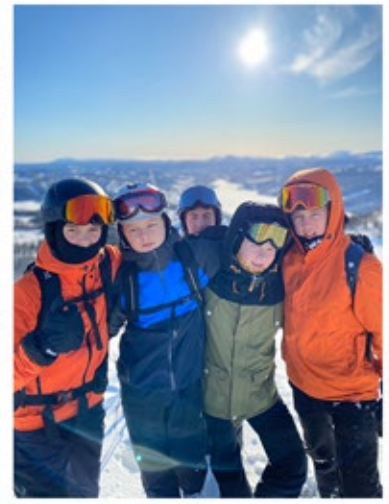
Här är gänget som var i Åre under sportlovet. Det blev härliga dagar! Tack alla ledare för er insats!