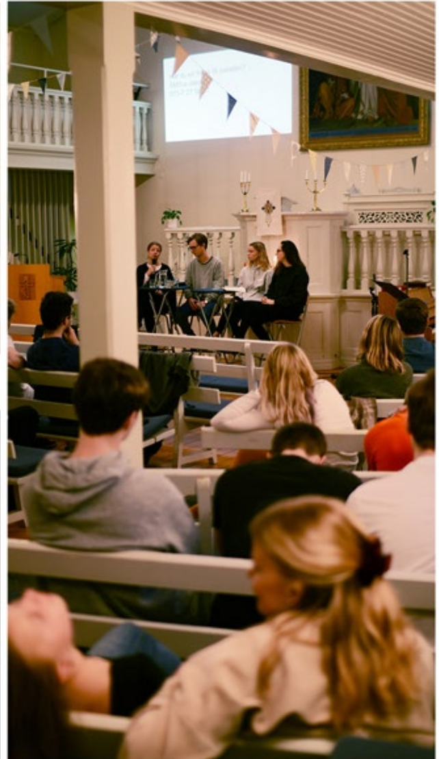
Vintermötet inspirerade till bibelläsning och introducerade 15 min bibel om dagen i 1 år.