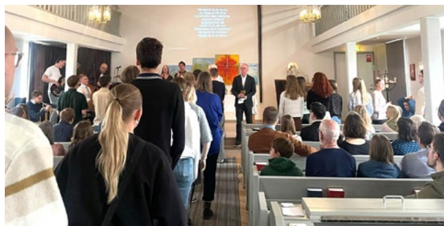
Båda påsklägerna avslutades med en underbar gudstjänst och mässa i ELF Kristianstad.