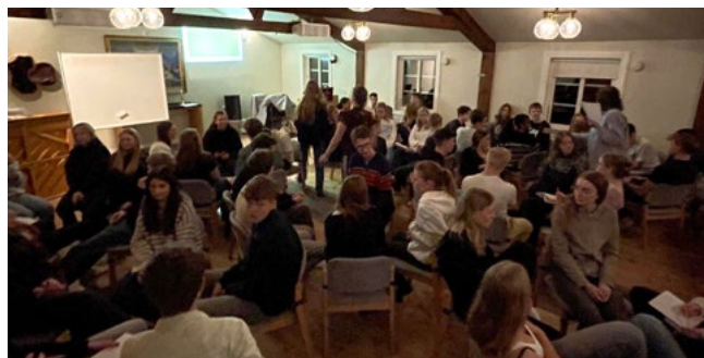
Breanäs Missionsgård fyllt med ungdomar.